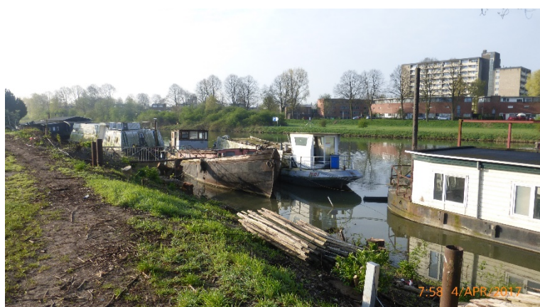
Foto: woonbootlocatie Stuwweg

Voor de woonboten langs de Zuid Willemsvaart (36 ligplaatsen) heeft de gemeente ligplaatsvergunningen verleend. In 2018 is gestart met de handhaving en dit is in 2019 doorgezet. Het resultaat is in 2019 zichtbaar geworden. Schuttingen en erfafscheidingen zijn verlaagd, verwijderd conform regels. Met de woonbootbewoners zijn afspraken gemaakt over de opschoning van de percelen en het nakomen van de regels van het bestemmingsplan en de APV. In enkele gevallen is daarbij handhavend opgetreden.