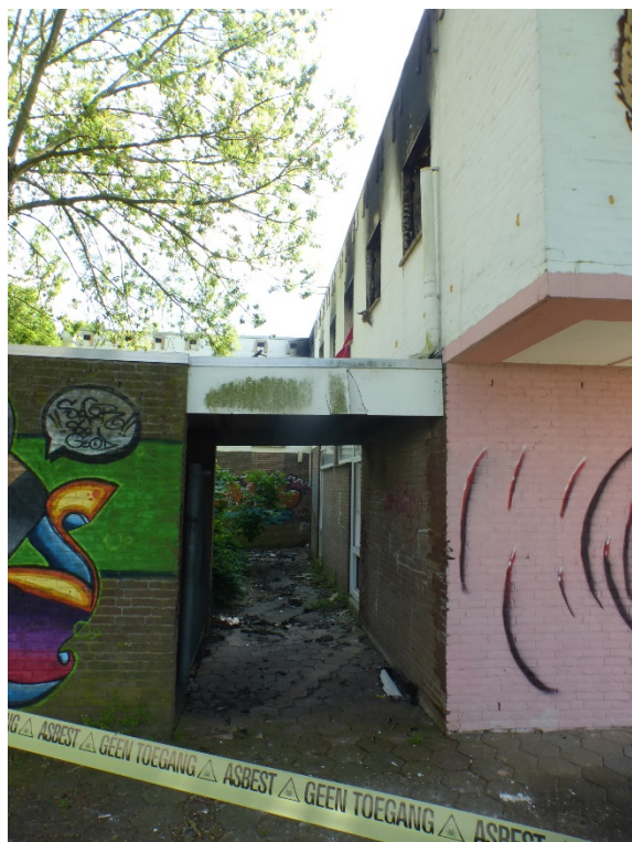
Foto: vrijkomen asbest na brand

We zien een lichte toename van relatief kleinschalige asbestsaneringen. Waarschijnlijk is de aankomende (dure) saneringsverplichting de oorzaak hiervan. Particulieren mogen zonder hulp van een erkende saneerder, een beperkt aantal vierkante meters golfplaten zelf van het dak verwijderen, echter zonder ze te breken. Wij constateren dat deze kleinschalige asbestsaneringen nogal eens onoordeelkundig en daarmee gevaarlijk worden uitgevoerd.